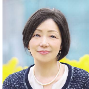
浜田 敬子 / ジャーナリスト