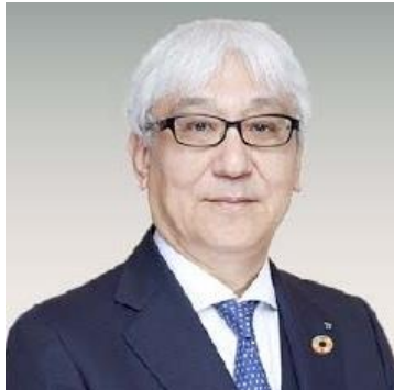
岩井 睦雄 / JT会長、経済同友会